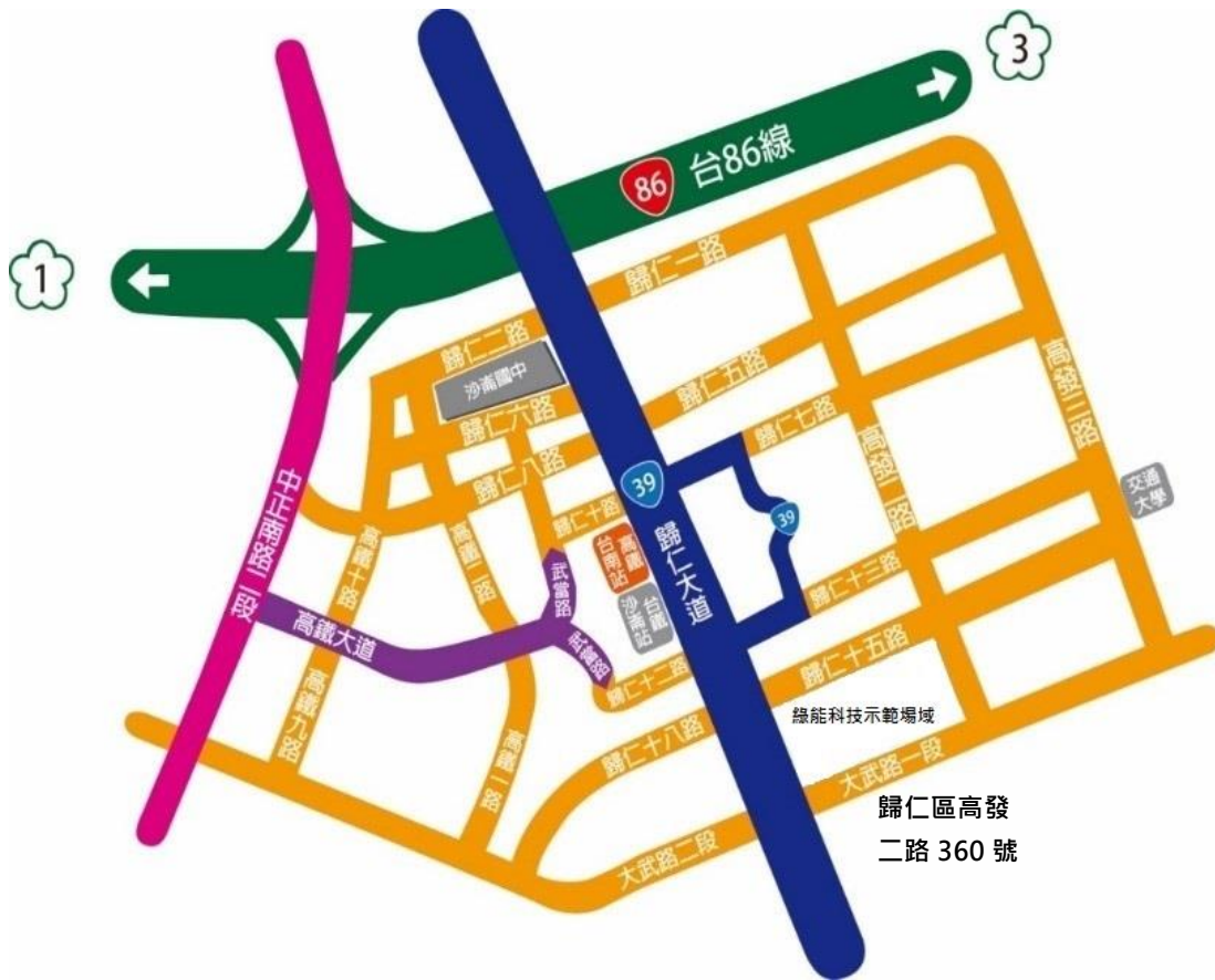
圖一、綠能科技示範場域位置圖