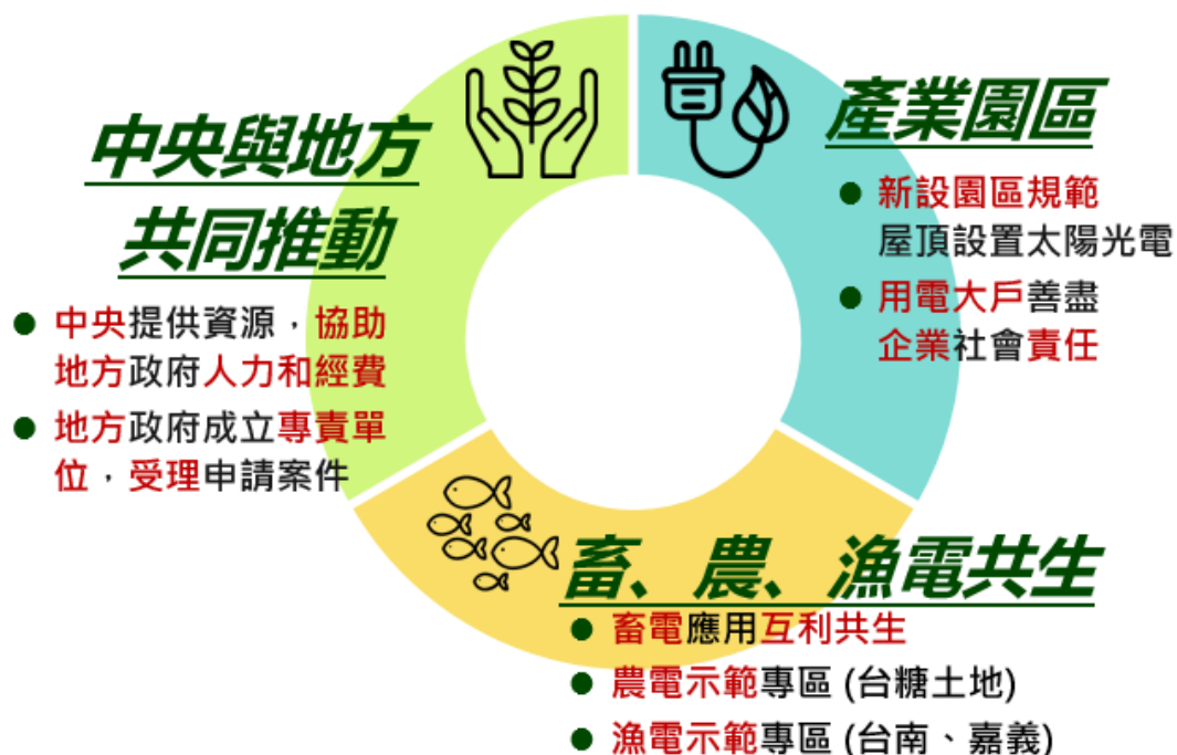
圖 5、「109 年太陽光電 6.5GW 達標計畫」三大主軸

「 中央與地方共同推動 」則係中央單位與地方政府一同攜手推動太陽光電，過去經濟部補助地方政府進行再生能源資源調查、推動策略規劃、推廣策略規劃與執行等，已有多年成果，地方政府依據過去的成果，規劃設置行動專案並落實設置，可作為中央與地方合作推動模式，如圖 5 所示。