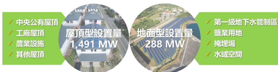
圖 2、「太陽光電 2 年推動計畫」推動成果

「太陽光電 2 年推動計畫」透過設立單一服務窗口、盤點可設置空間、強化電網規劃及法規制度修訂等措施，優化太陽光電設置環境。成功帶動總設置量達 1,779 MW，其中屋頂型設置達 1,491MW、地面型設置達 288MW，達成原訂 1,520MW 設置目標。